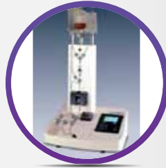
CLINIMACS PLUS PARA USO CLÍNICO