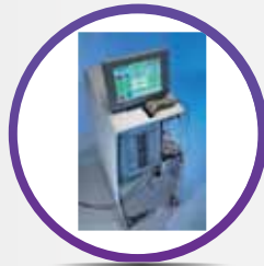
THERASORB AFÉRESIS TERAPÉUTICA